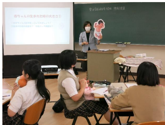
保育実習室での実技講習の様子